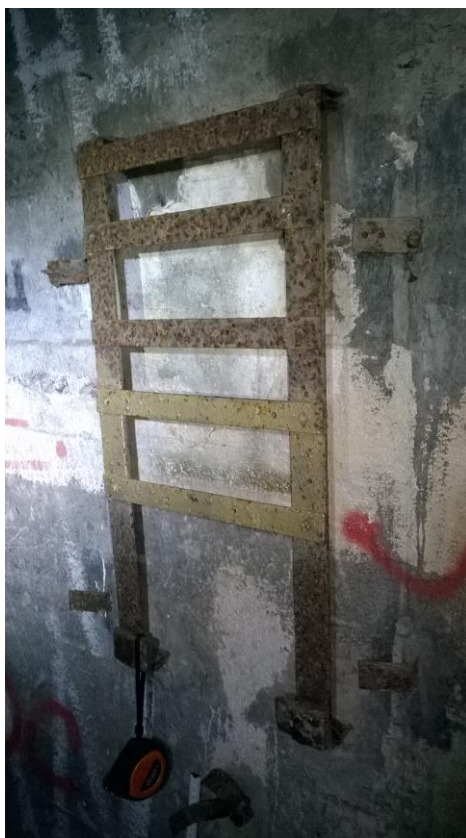
zdj. 4 – Relikty pozostawione w schronie.