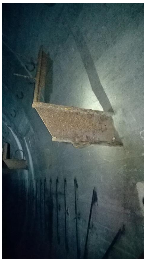
zdj. 5 – Wsporniki pozostawione w obiekcie.