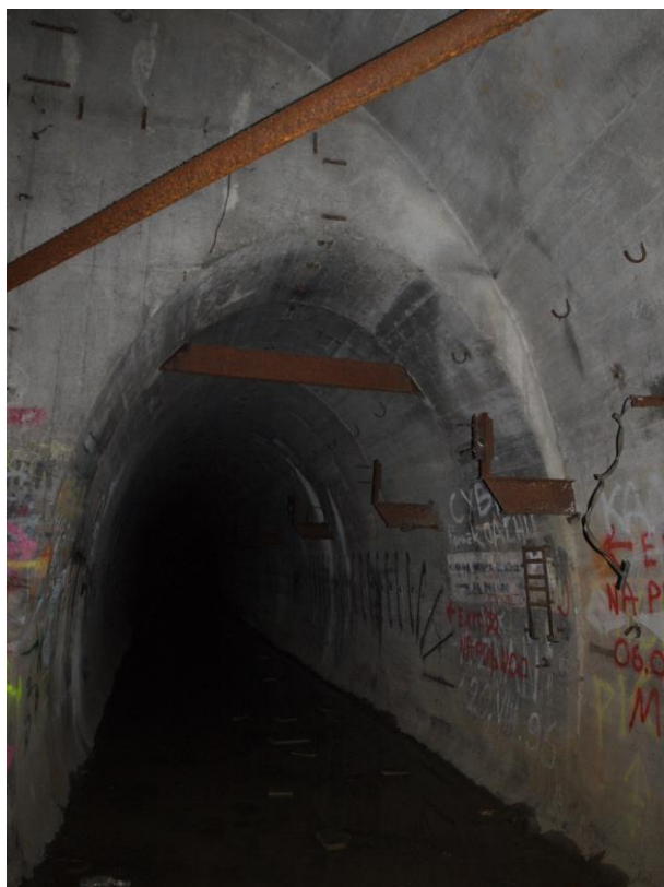
zdj. 3 – Korytarz przeznaczony do zamknięcia – stan istniejący.