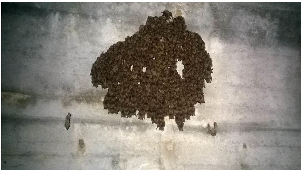
zdj. 1 – Nietoperze zimujące w MRU.