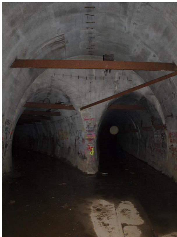
zdj. 2 – Stan istniejący korytarza.